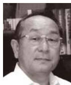
<舞台監督・美術> 本川 國雄

遅々として進まない震災復興。とりわけ原発事故では 経済主導の中で培われた価値観の無力さの前で多くの 人が戸惑っています。「より豊かに」「より便利に」の中で 「老々介護」「失業者」「生活保護者」は着実に増加し、先き 行き不安の中で多くの人々がおののいています。この 40年の間に私たちは何を得、何を失ったのでしょうか。 この舞台で一緒に考えてみませんか。皆様のご来場を 心からお待ち申し上げます。